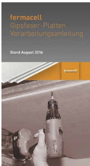
Die neue Verarbeitungsanleitung Gipsfaser-Platten ist online verfügbar sowie unter facebook und auf der Fermacell App.

Gipsfaser-Platten sind die Allrounder im Trockenbau. Sie vereinen unterschiedliche Platteigenschaften in einem