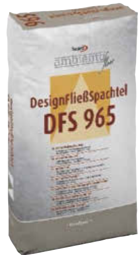
Das Produkt eignet sich besonders für den Einsatz in repräsentativen Räumen.

Viele Bauherren und Planer wünschen sich gerade im Bereich des Laden- und Gewerbebaus möglichst hochwertige, ansatzfreie und fugenlose Bodenbeschichtungen, die wie ein Unikat ausschauen. Diesen Wunsch kann die Sopro Bauchemie nun mit dem neuen Sopro ambiente floor Designfließspachtel, einer zementären Fließspachtelmasse, mit der sich direkt nutzbare und hochbelastbare Unikatböden in ansatzfreier und edler Optik herstellen lassen, erfüllen. Bei dem Produkt handelt es sich um eine einkomponentige, zementäre Designfließspachtelmasse für Schichtdicken von fünf bis 15 Millimeter. Dank der Mikrodur-Technologie verfügt das selbstnivellierende Material über sehr gute Verarbeitungs- und Festmörteleigenschaften. Die hergestellten Böden sind bereits nach zwei bis drei Stunden begehbar so